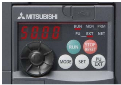
Das eingebaute Multi-User-Panel mit „Digital-Dial“

Mit dem integrierten „Digital Dial“ hat der Anwender einen viel schnelleren direkten Zugriff auf alle wichtigen Parameter, als es mit herkömmlichen Tasten möglich ist.