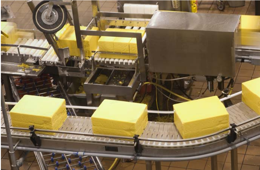
Materialtransport, wie in einem Druckverlag sind nur eine der vielfältigen Einsatzgebiete des FR-E700 SC