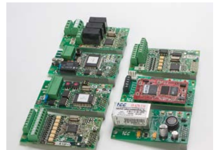
Optionskarten für erweiterte Funktionen

Die Montagefläche hat sich zum Vorgänger nicht verändert, jedoch können nun die FR-E700 SC direkt nebeneinander montiert werden. Die Wärmeabführung wurde optimiert, indem die Kühlkörper außerhalb des Schaltschranks angebracht werden können.