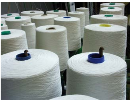
In der Textilindustrie sind Mitsubishi-Frequenzumrichter auch nicht mehr wegzudenken.